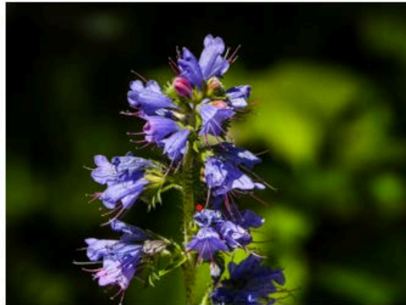
Wildpflanze des Jahres 2026, der Gewöhnliche Nattertkopf ( Echium vulgare )